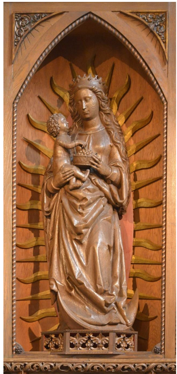
Dom St. Peter Osnabrück; Foto Bernhard Bauer

„Später reute es ihn und er ging hinaus. – Die Zöllner und die Dirnen gelangen eher in das Reich Gottes als ihr.“