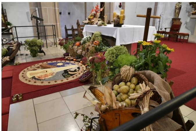
St. Johannes Baptist Schwaney 2022; Foto Bernhard Bauer

die in diesen Tagen die wunderschönen Erntedankaltäre in den Kirchen des Pastoralen Raumes gestaltet haben!