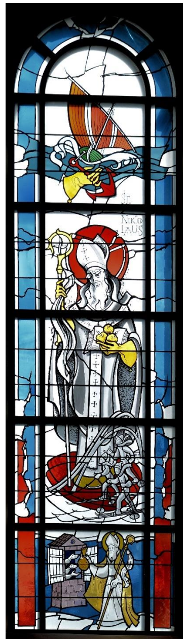
St. Jakobus der Ältere, Winterberg

„Kehrt um! Denn das Himmelreich ist nahe.“