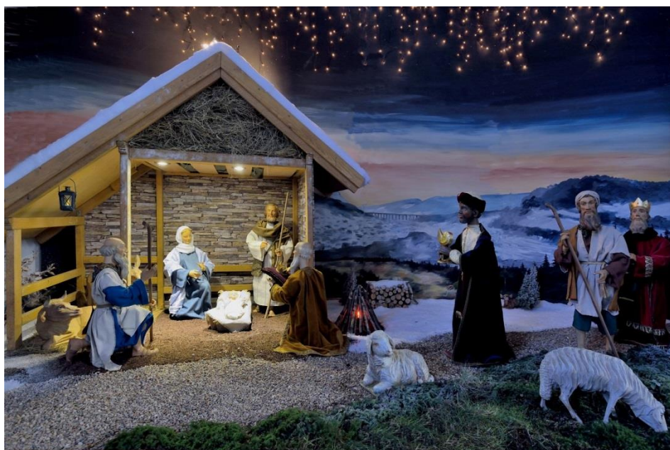
Heilig Kreuz Altenbeken