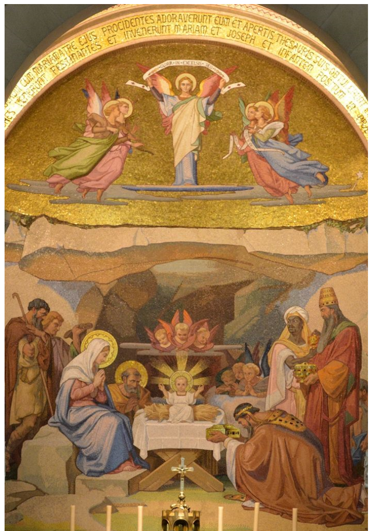
Mosaik Rosenkranzbasilika Lourdes