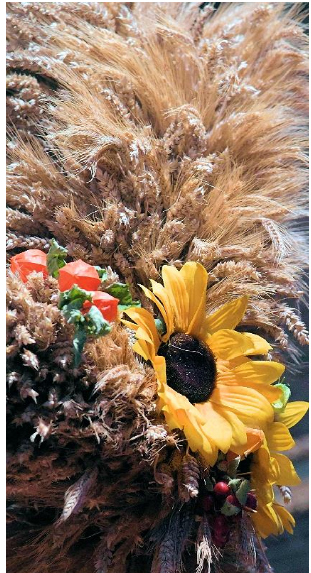
Ausschnitt aus einer Erntekrone

HERZLICHEN DANK Allen, die in diesen Tagen die wunderschönen Erntedankaltäre in den Kirchen des Pastoralen Raumes gestaltet haben!