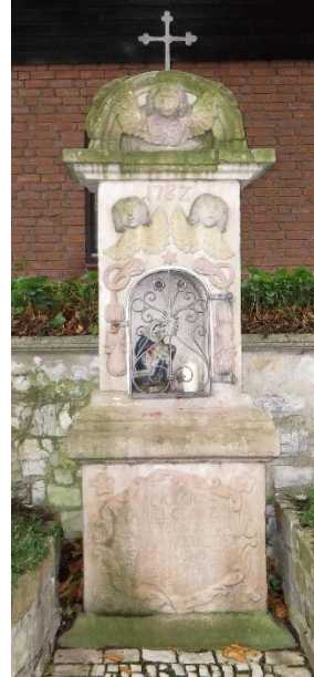
vor der Reinigung

Vielleicht haben einige im Vorbeigehen schon bemerkt, dass am o.g. Heiligenhäuschen Aktivitäten zu beobachten sind. Die letzte Renovierung lag über 30 Jahre zurück und der Stein war stark vermoost und die Bemalung inzwischen verblasst. Die Fachfirma Nüthen aus Bad Lippspringe bearbeitet zurzeit den Stein. Die Bilder zeigen den Zustand vor der Reinigung, nach der Reinigung und jetzt beim Auffrischen der Farben.