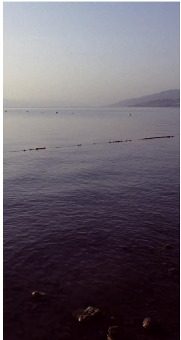
See Genezareth

„Herr, befiehl, dass ich auf dem Wasser zu dir komme.“