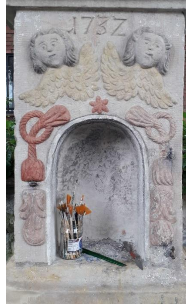
nach der Reinigung/ Beginn der neuen Bemalung