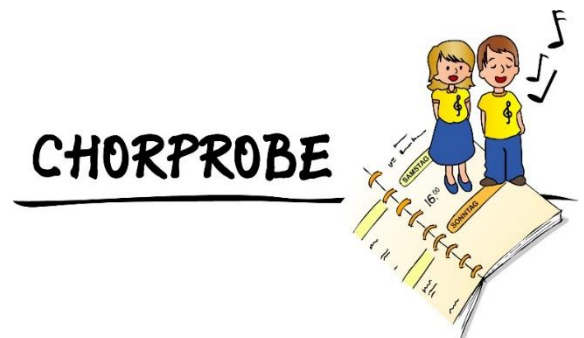
Grafik: Birgit Seuffert, Factum/ADP; pfarrbriefservice.de

Der Kinder- und Jugendchor an St. Martin nimmt wieder neue Sängerinnen und Sänger auf. Kinder ab dem 3. Schuljahr können sich dazu in der letzten Augustwoche anmelden. Am Donnerstag, 25. August, um 17:00 erwartet Chorleiter Reinhold Ix die Neuen zu einem kleinen Vorsingen. Die Kinder kommen dazu in Begleitung eines Erziehungsberechtigten ins Pfarrheim St. Martin, Martinstr. 22, in dem auch die Chorproben donnerstags von 17:30 bis 18:45 stattfinden.