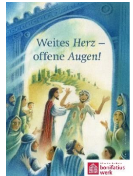
Erstkommunionmotiv 2023: Giuliano Ferri

In Kürze beginnt die Kommunionvorbereitung für alle Kinder, die im Frühjahr 2023 zur ersten heiligen Kommunion gehen sollen. Traditionsgemäß sind das die Kinder, die derzeit die 3. Klasse besuchen. Aber auch ältere Kinder, die noch nicht zur Kommunion gegangen sind, sind herzlich eingeladen. Zu ersten Eltern-Informationsabenden laden wir herzlich ein: