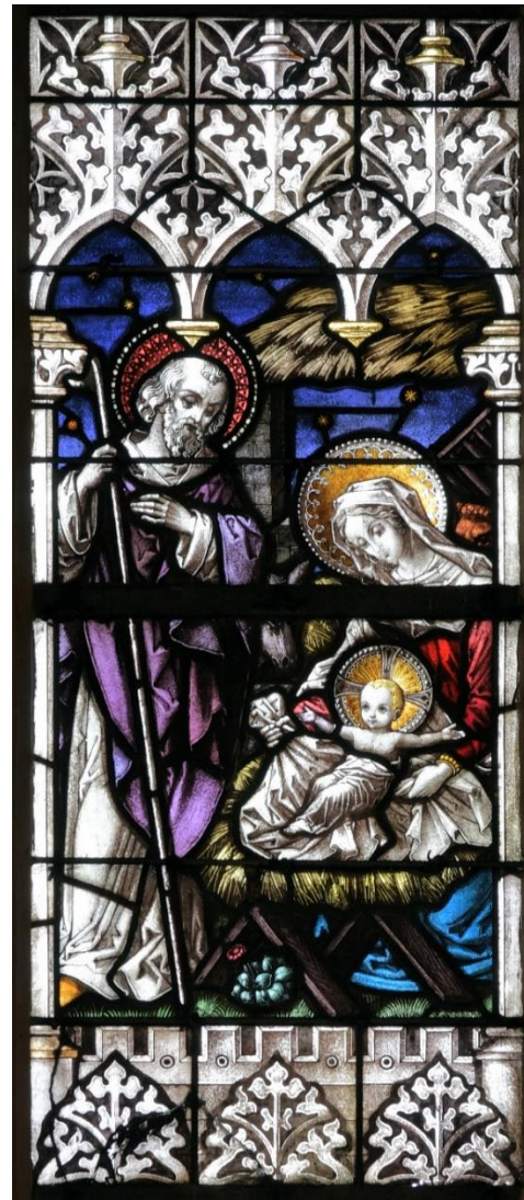
Heilig Kreuz Altenbeken

WIR WÜNSCHEN ALLEN GEMEINDEMITGLIEDERN UND GÄSTEN EIN GESEGNETES WEIHNACHTSFEST UND EIN FROHES NEUES JAHR 2021!