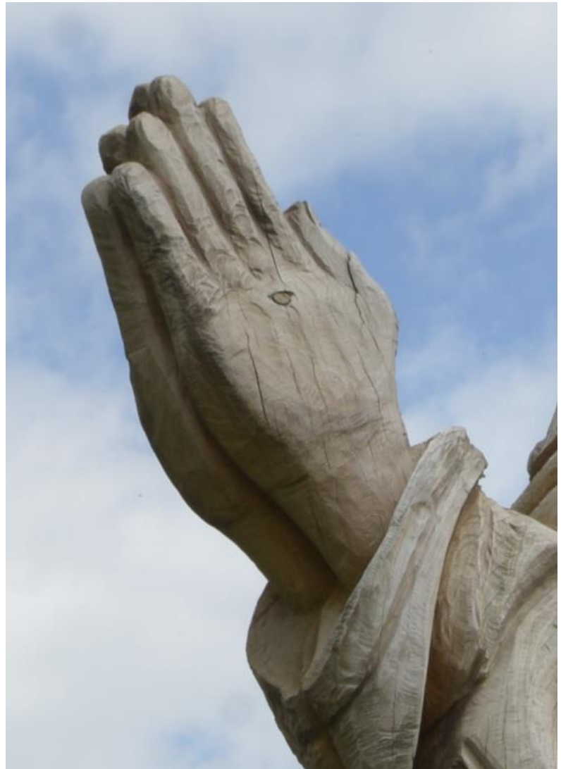
Jubiläumsbaum auf dem Hohenpeißenberg; Foto Bernhard Bauer