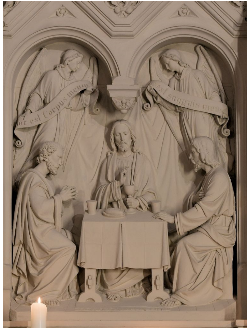
St. Dionysius Buke