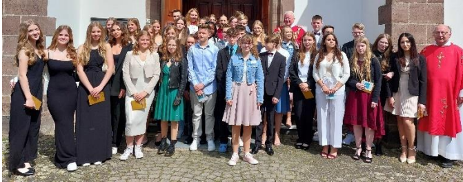
St. Martin Bad Lippspringe