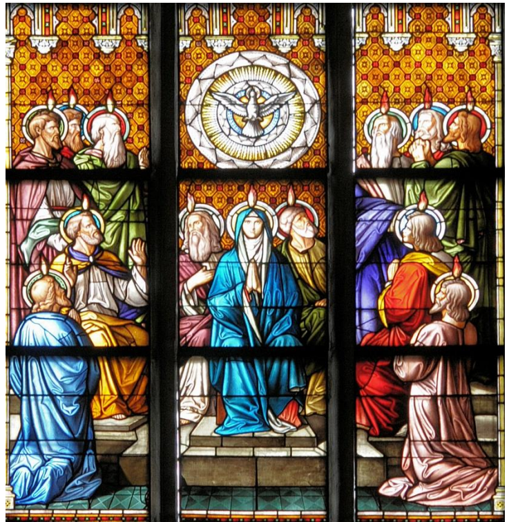
Propsteikirche St. Ludgerus Billerbeck

„Wie mich der Vater gesandt hat, so sende ich euch: Empfangt den Heiligen Geist.“