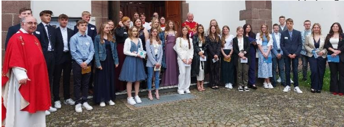
St. Martin Bad Lippspringe