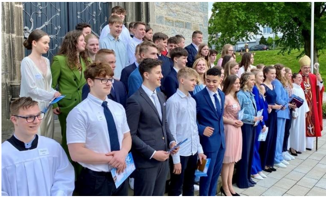
Heilig Kreuz Altenbeken