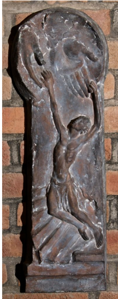
Barmherziger Vater, St. Bonifatius Paderborn; Foto Bernhard Bauer